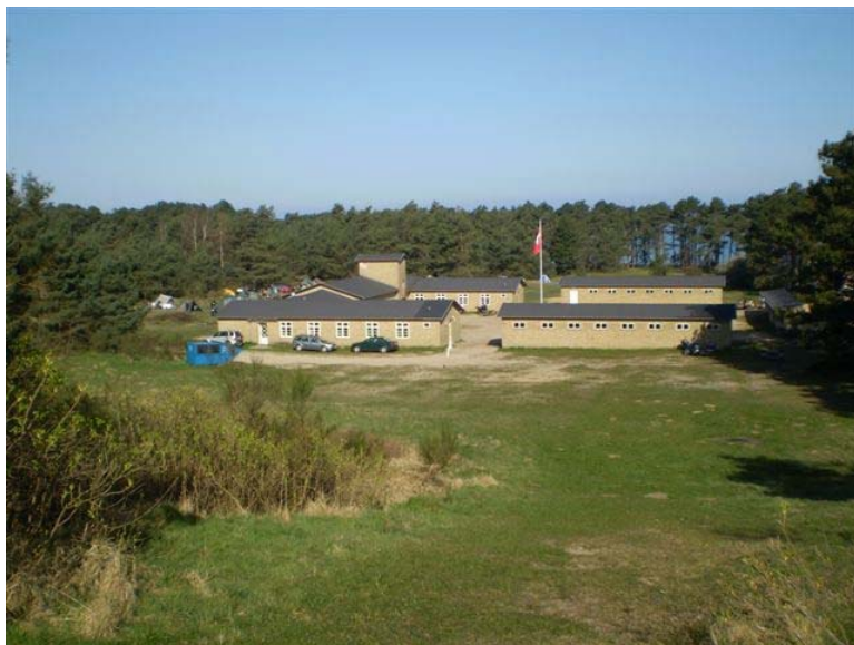
”Klinteborg” eller ”Ørkenfortet” som nogle kalder stedet. Foråret er kommet med sol og høje temperaturer.

Men hvad hjælper det, når man er blevet stækket i en sådan grad at motorcykelkørsel i 5 uger er noget man snakker om, men ikke kan deltage i.