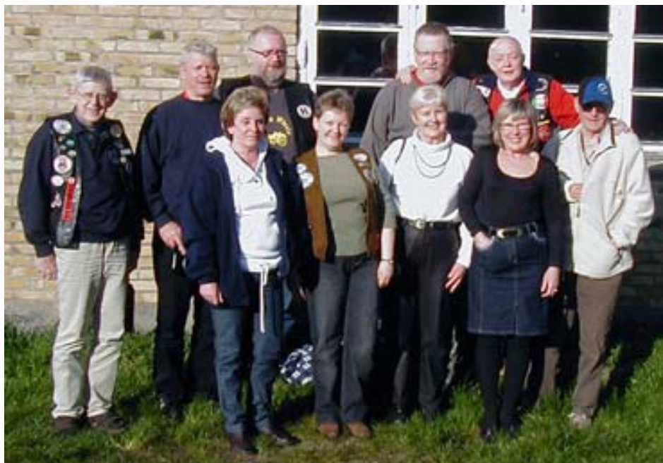
Den nye bestyrelse efter generalforsamlingen.