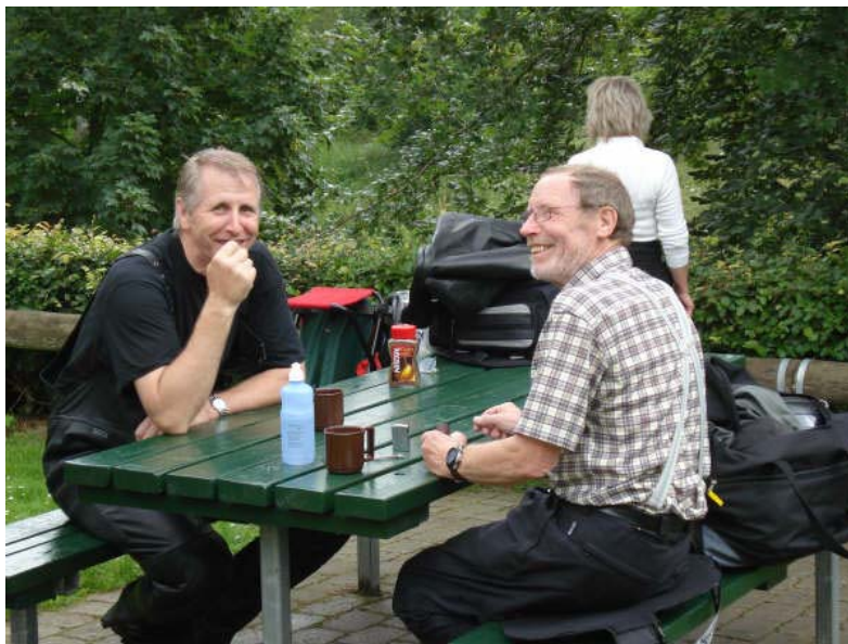
Madpakketur til Tange Værket

"Et smil koster mindre end strøm. Og det er nemmere at lyse op med." Anonym